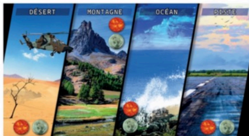
Exemples de didacticiels créés par la cellule NEF de l'EM EALAT.

Domaine "Maintenance des Matériels Aéronautique" : après plusieurs mois de travaux d'état-major, considérant la nécessité d'optimiser la durée des formations MMA, le COMALAT a décidé le 3 juin de la suppression de la formation de base armement (Be ARM) pour les sous-officiers avioniques orientés sur HMA. Le gain de temps de 6 semaines sera profitable aux unités avec une mise à disposition plus rapide des sous-officiers de ce cursus, tout en contribuant à la motivation et à la fidélisation du personnel. Cette mesure sera effective dès la prochaine session, prévue de débuter le 29 août 2022.